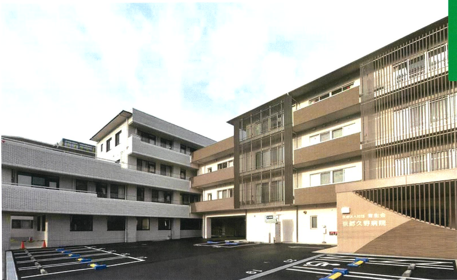
2017年に改築された京都久野病院。2019年には介護療養病床を介護医療院に転換。医療棟に併設して介護医療院があるため、医療と介護の連携がスムーズになった。医療行為が必要となった際は、速やかに京都久野病院の病棟に転換することができる。症状が安定すれば再び介護医療院に移ることもできる。