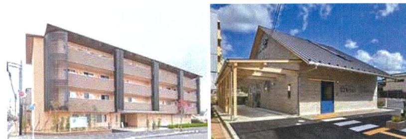
京都久野病院から徒歩2分ほどの場所にある「高齢者福祉施設 レット・イット・ビー」(左)と「機能訓練型デイサービス ロコモーション」(右)。それぞれビートルズとトリル・エヴァの曲から、久野理事長が命名したそう。「音楽の良いところは、その曲を聴くとすぐにその当時にタイムスリップできること。若かり頃の1970代のヒットソングに乗り、当時に戻っていただきたいと思い名付けました」。