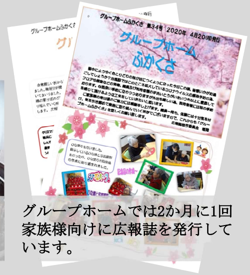
グループホームでは2か月に1回家族様向けに広報誌を発行しています。