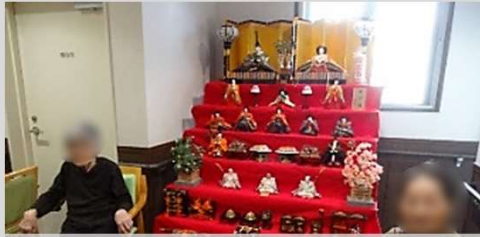
ひなまつりはひな壇の前で記念撮影をしました。おやつは職員手作りの三色ゼリーでした。