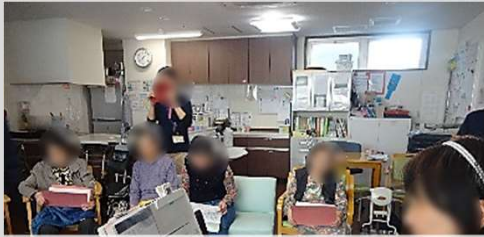
唄会を開催しました。懐かしい歌謡曲から童謡まで、楽しそうに一生懸命歌っておられました。

育生会では伏見区深草西浦町内で4施設の運営をしています。「ふかくさ」で実施のイベントを紹介します。