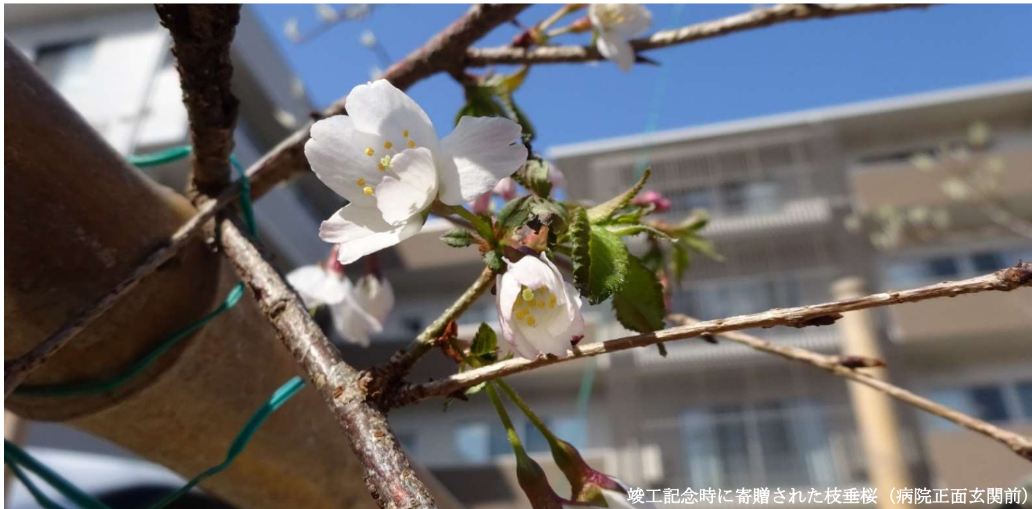
竣工記念時に寄贈された枝垂桜（病院正面玄関前）